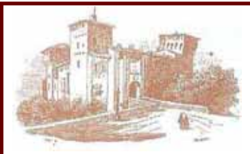
La Rocca di Romano di Lombardia