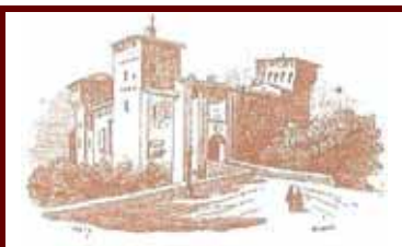
La Rocca di Romano di Lombardia