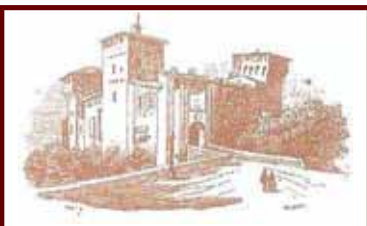
La Rocca di Romano di Lombardia