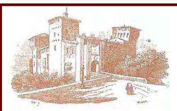
La Rocca di Romano di Lombardia