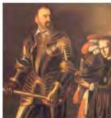
Caravaggio, Ritratto di Aiof de Wignacourt olio su tela cm 195 x 134, particolare Musée du Louvre, Parigi.

regia: Fabio Cosmana in collaborazione con Erbami