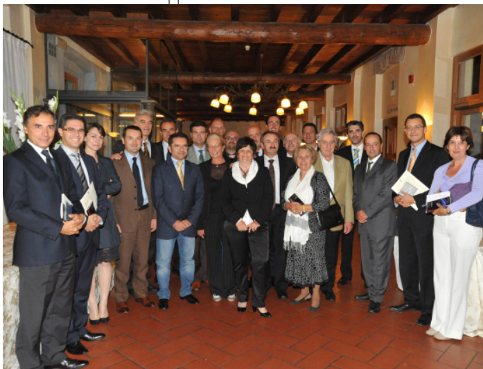
Il ... plotone dei Sindaci ed Assessori

solidi sempre di più per coordinare al meglio le attività di servizio nelle aree di competenza.