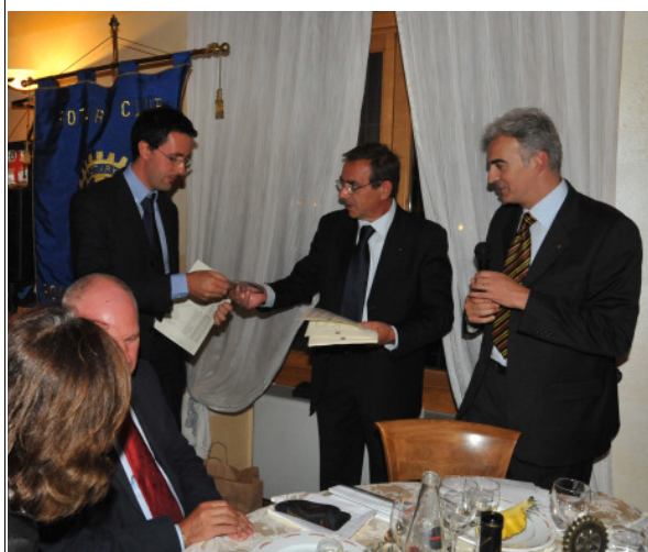
La consegna dei volumi ad uno dei Sindaci

Romano di Lombardia, l'ormai collaudata iniziativa "Una goccia per il tuo cuore", oltre alle numerose borse di studio organizzate dal Rotary International a favore di giovani meritevoli e, non ultimo, il Progetto di Alfabetizzazione su cui tanto il Distretto 2040 punta in quest'anno rotariano.