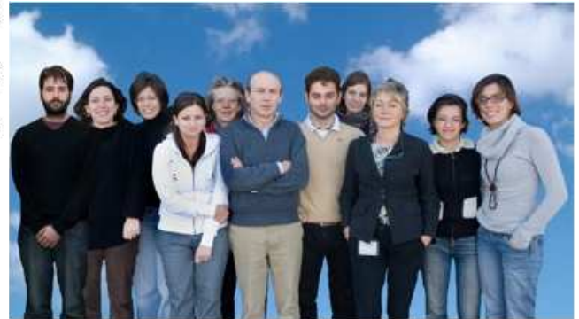
Il team dei ricercatori del Laboratorio di Infiammazione e Malattie del Sistema Nervoso Centrale

Il pagamento può essere effettuato tramite bonifico a favore dell'Istituto Mario Negri presso: INTESA SANPAOLO - FILIALE 1906, Via Tritussa 13 - (20157 Milano) IBAN IT90 T030 6909 5460 0000 0549 107 - BIC BCITMM